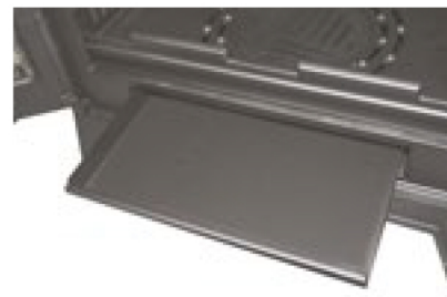
Cajón cenicero extraíble para facilitar la limpieza Gaveta de cinzas extraível para fácil limpeza.